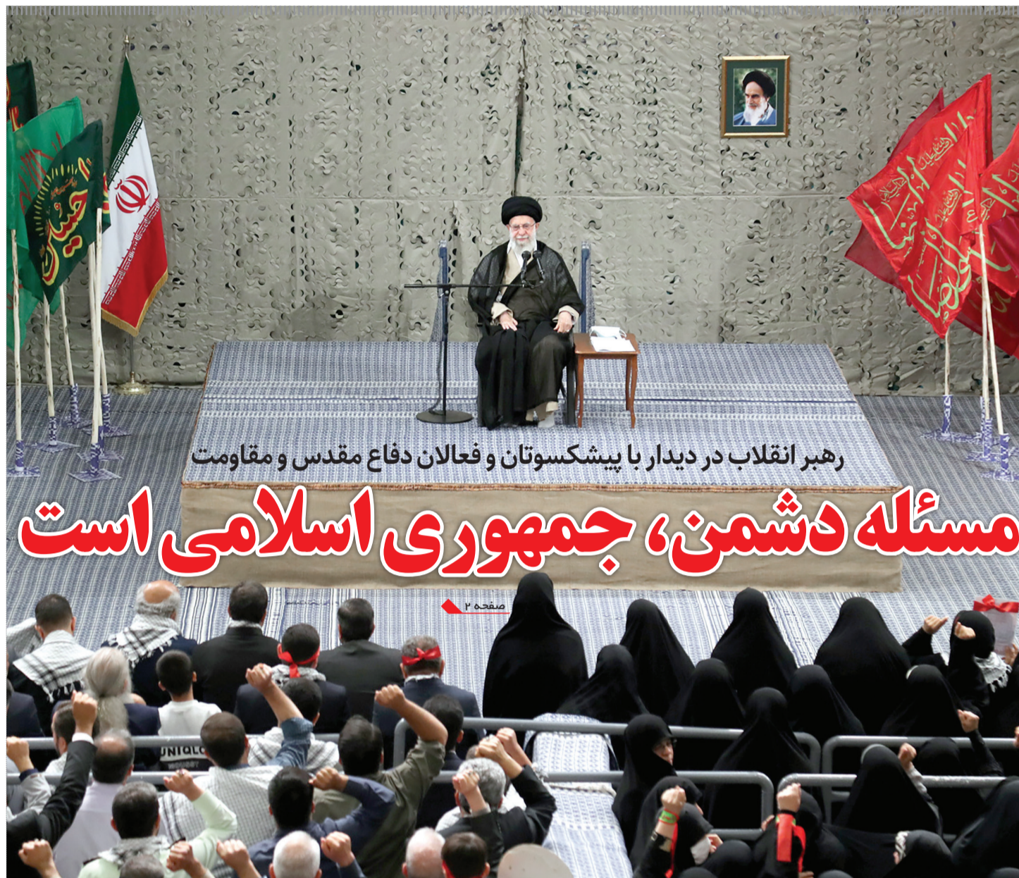
رهبر انقلاب در دیدار با پیشکسوتان و فعالان دفاع مقدس و مقاومت