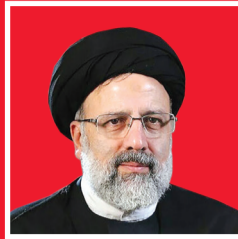
رئیس جمهور: دولت به دنبال انتخاباتی پرشور رقابتی، سالم و امن است