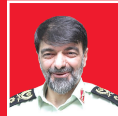
سردار رادان: کنترل سارقان الکترونیکی شد